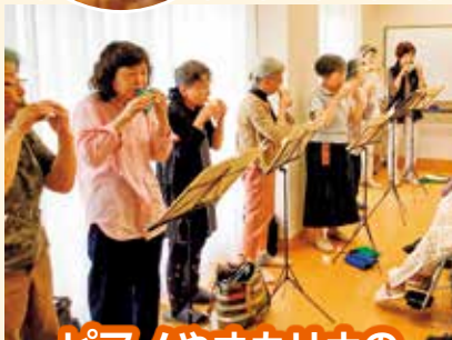
ピアノやオカリナの演奏会