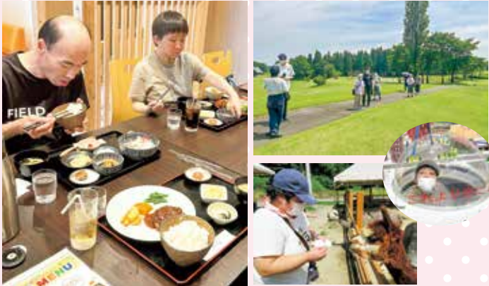
昼食を味わいながら 楽しい時間を過ごしました