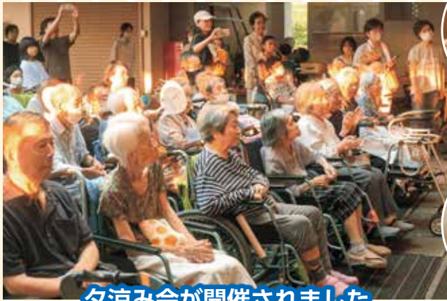
夕涼み会が開催されました